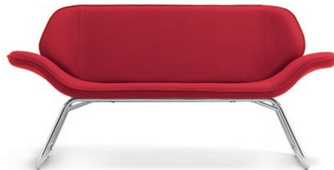
VL002C Divano, struttura cromata Two-seater, chromed base

Il divano a due posti presenta un design pulito e ben distribuito; la struttura di supporto molto leggera che accentua l'eleganza formale è disponibile nella finitura cromata o verniciata bianca.