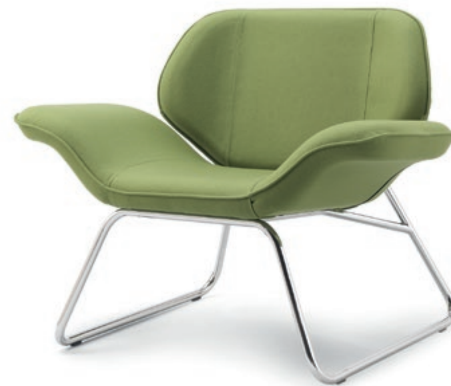
VL001C Poltrona, struttura cromato Armchair, chromed base