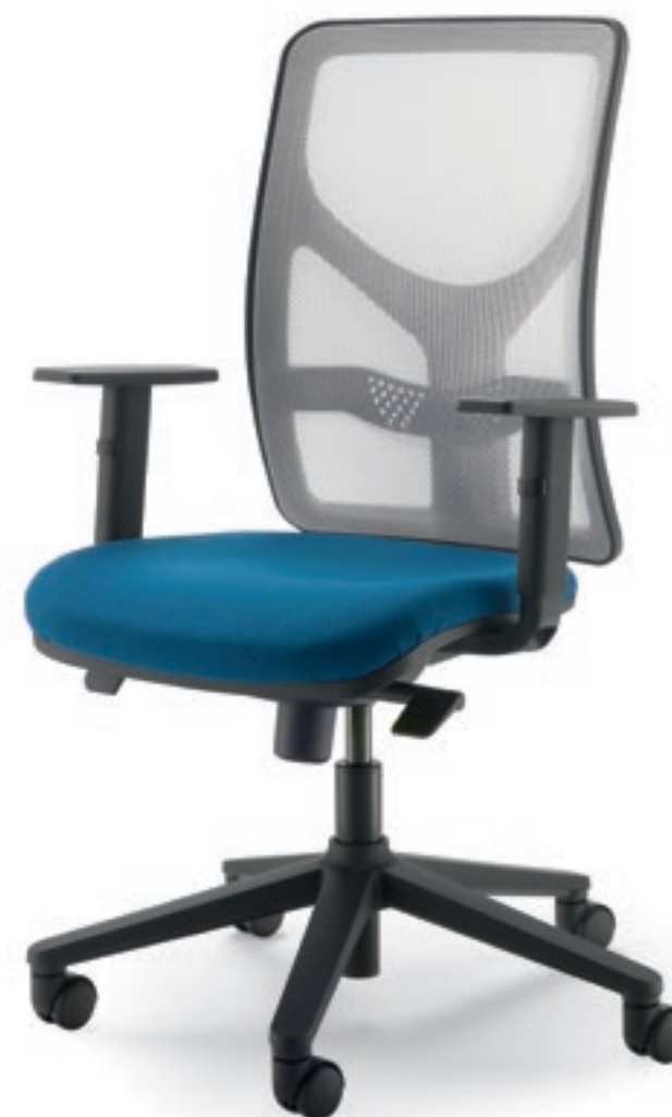
YP351SD+BR003 Schienale alto, sincro, braccioli regolabili in altezza High back, synchro mechanism, high adjustable armrests

Full range of task seatings with up-to-date design. Two dimensions backrest and two arms options, Y is equipped with synchro mechanism to fill basic requirements for relaxing working office hours, with personal design and maximum operation options.