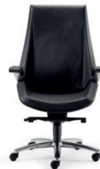
CQ001A Schienale alto, meccanismo oscillante a fulcro avanzato, braccioli High back, forward tilting mechanism, armrests