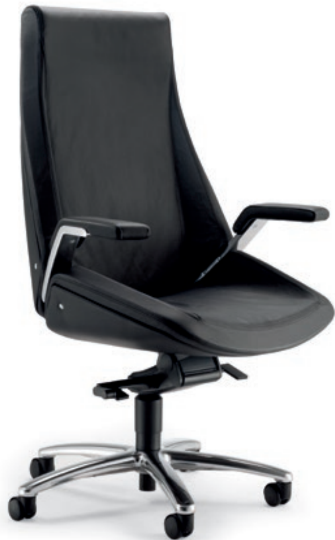
CQ001A Schienale alto, meccanismo oscillante a fulcro avanzato, braccioli High back, forward tilting mechanism, armrests

Cuciture sartoriali, braccioli in alluminio, imbottiture in poliuretano espanso flessibile schiumato ignifugo, meccanismo a fulcro avanzato con regolazione della tensione tramite leva laterale, basi in alluminio. Il top per il massimo.